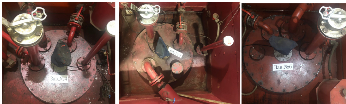
Рисунок 2 – Общий вид резервуаров РГС-25