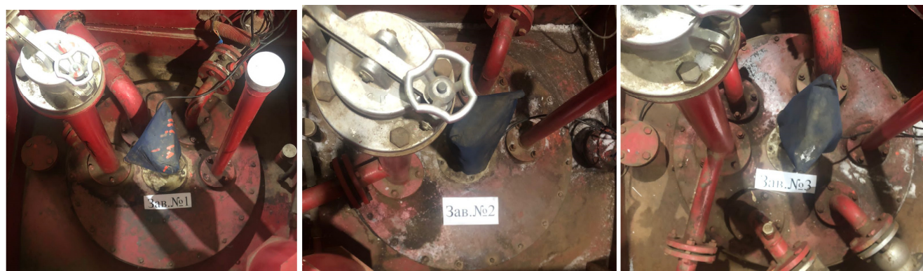
Рисунок 1 – Общий вид резервуаров РГС-25

Нанесение знака поверки на средство измерений не предусмотрено.