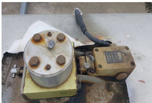
а) пломбирование детектора