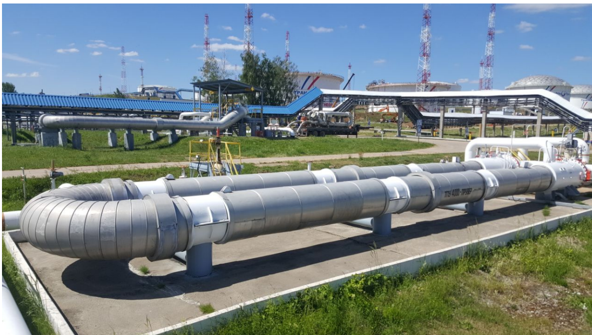
Рисунок 1 - Общий вид ТПУ

Фланцевые соединения измерительного участка (4 шт.) и детекторы положения шарового поршня (2 шт.) пломбируются поверителем (рис. 2).