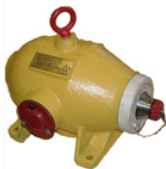
Рисунок 3 – Общий вид блоков гамма-излучения