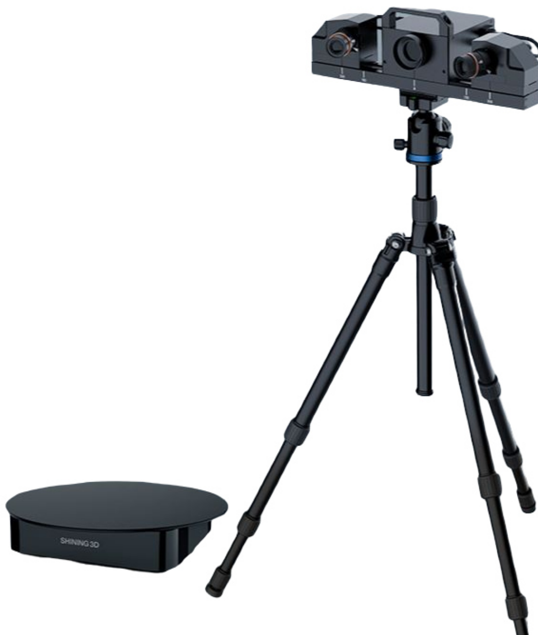
Рисунок 1 – Общий вид приборов оптических координатно-измерительных бесконтактных Shining 3D Transcan C

Общий вид меток и пример их нанесения на объект сканирования представлен на рисунке 2.