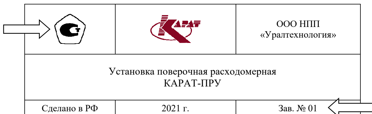
Рисунок 3 – Обозначения мест нанесения знака утверждения типа и заводского номера

Обозначения мест нанесения знака утверждения типа и заводского номера представлены на рисунке 3.