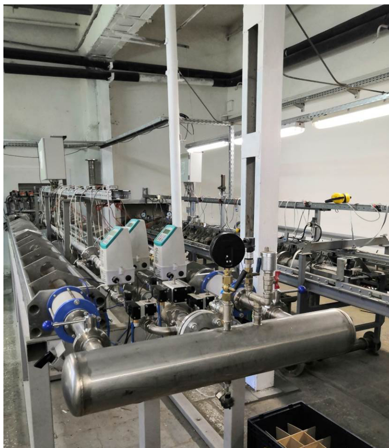
Рисунок 1 – Общий вид установки

Общий вид установки представлен на рисунке 1.