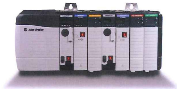
Рисунок 1 – Внешний вид контроллера ControlLogix (серия 1756)

На рисунке 1 приведён внешний вид контроллера ControlLogix (серия 1756).