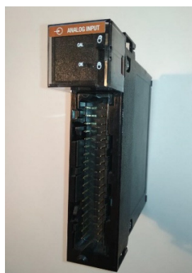
Рисунок 2 – Измерительный модуль 1756-IF16

На рисунке 2 приведён внешний вид измерительных модулей контроллера ControlLogix (серия 1756) со стороны терминальной панели.