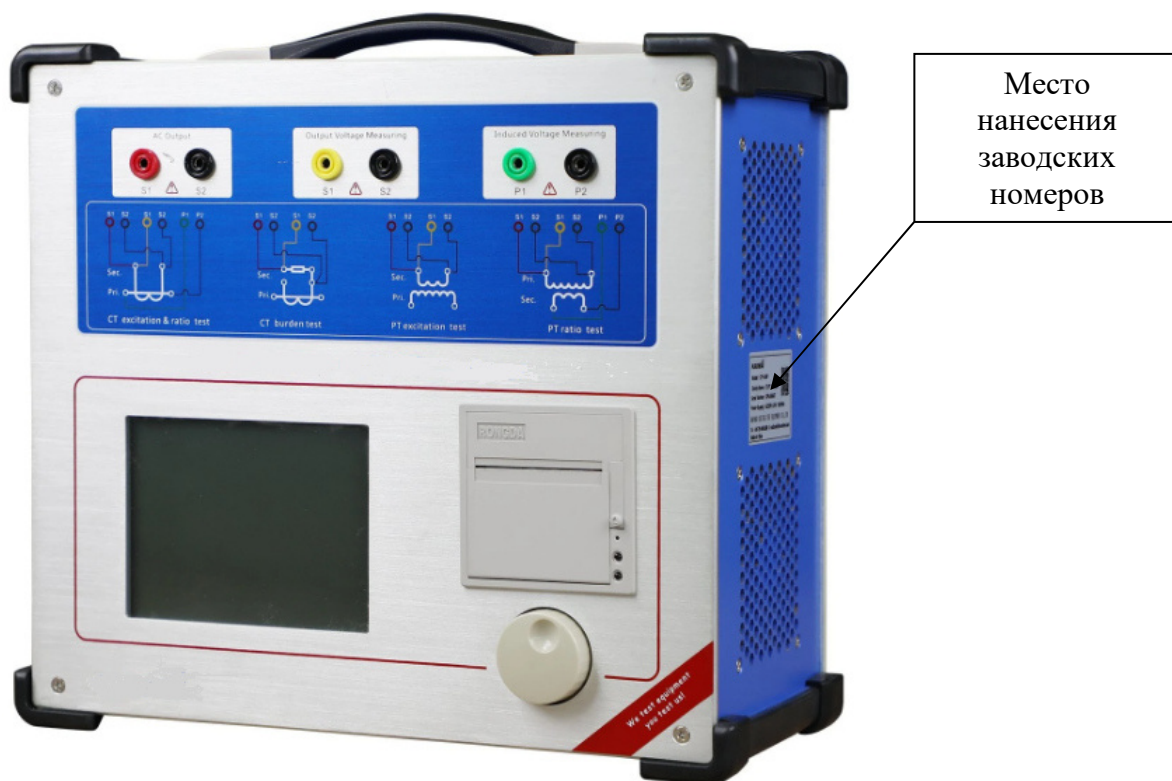
Рисунок 2 – Общий вид анализаторов ТТ/ТН и обозначение места нанесения заводских номеров