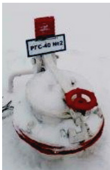
Рисунок 3 – Фотография горловины и заводского номера резервуара стального горизонтального цилиндрического РГС-40, заводской номер 2

Пломбирование резервуаров стальных горизонтальных цилиндрических РГС-40 не предусмотрено.