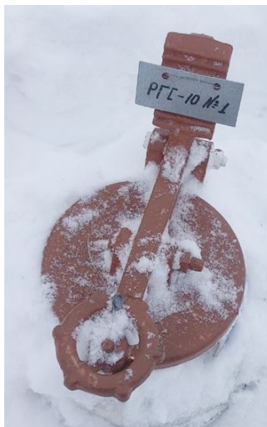
Рисунок 2 – Фотография горловины и заводского номера резервуара стального горизонтального цилиндрического РГС-10, заводской номер 1