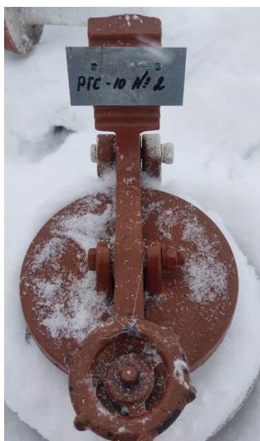
Рисунок 3 – Фотография горловины и заводского номера резервуара стального горизонтального цилиндрического РГС-10, заводской номер 2

Пломбирование резервуаров стальных горизонтальных цилиндрических РГС-10 не предусмотрено.