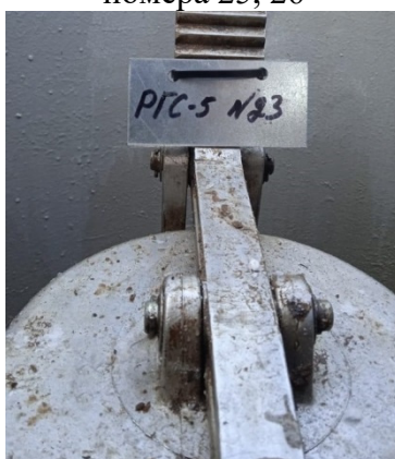
Рисунок 3 – Фотография горловины и заводского номера резервуара стального горизонтального цилиндрического РГС-5, заводской номер 23