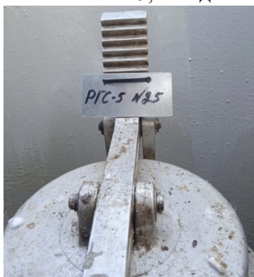
Рисунок 4 – Фотография горловины и заводского номера резервуара стального горизонтального цилиндрического РГС-5, заводской номер 25