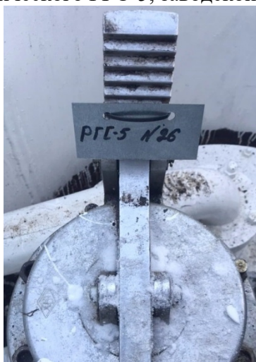
Рисунок 5 – Фотография горловины и заводского номера резервуара стального горизонтального цилиндрического РГС-5, заводской номер 26