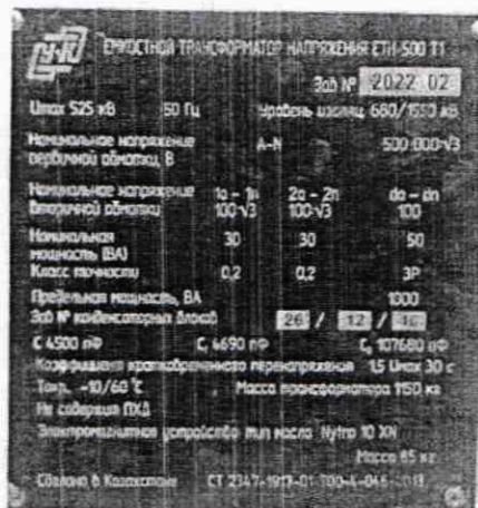
Рисунок 1. Маркировка емкостных трансформаторов напряжения