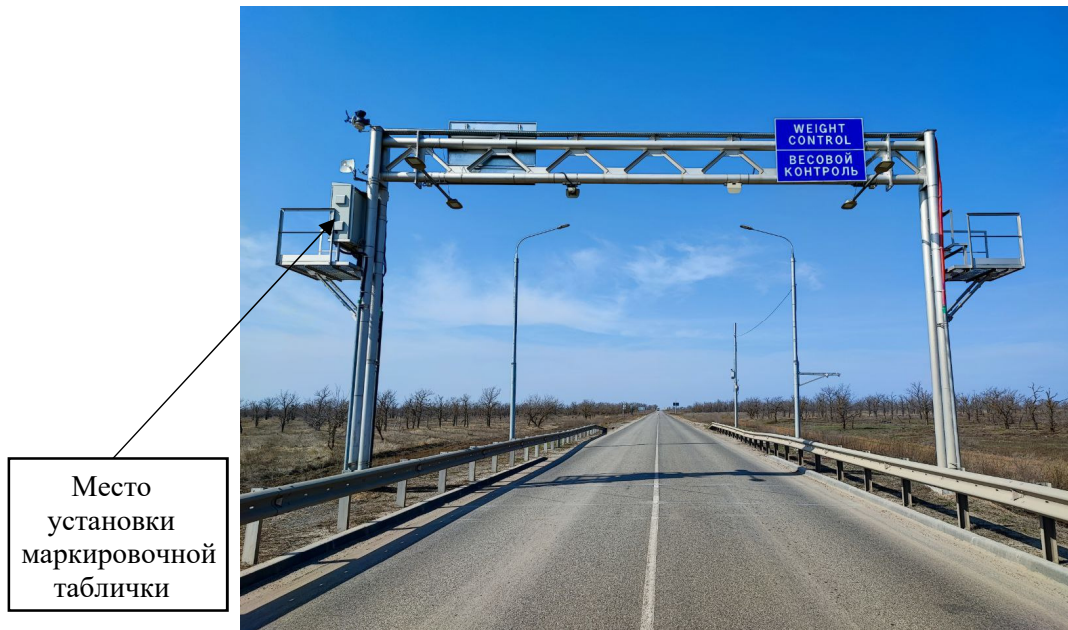
Рисунок 1 – Общий вид системы СКИП-Траффик ВГК