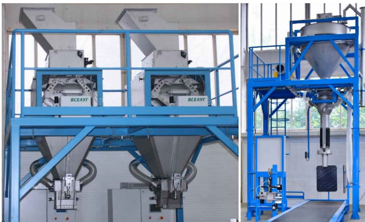
Рисунок 1 - Общий вид дозаторов

Нанесение знака поверки на средство измерений не предусмотрено.