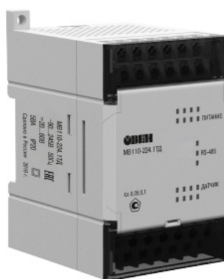
Рисунок 4 – Общий вид электронных устройств средства измерений.