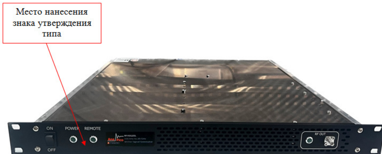
Рисунок 1 - Общий вид генераторов.