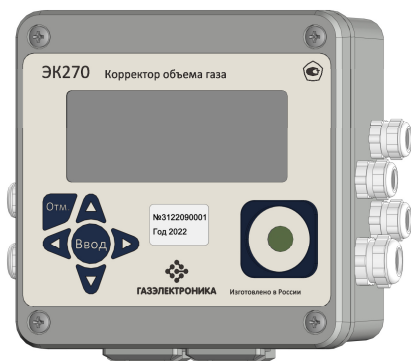
Рисунок 1 – Общий вид корректора объема газа ЭК270