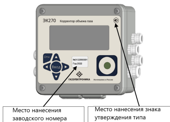
Рисунок 2 – Места нанесения знака утверждения типа и заводского номера