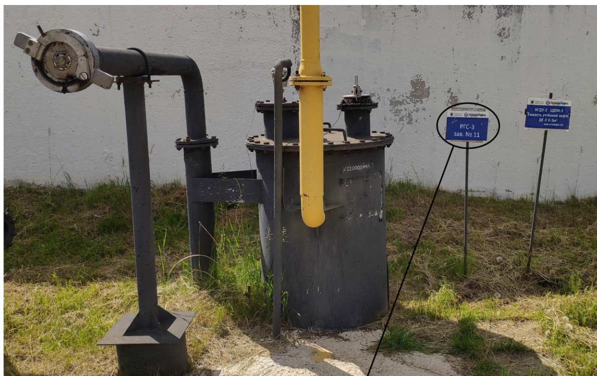
Место нанесения заводского номера