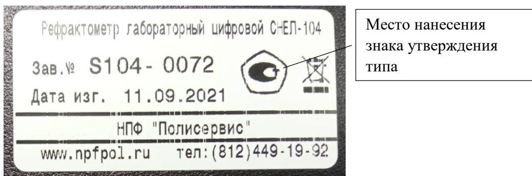
Рисунок 3- Общий вид таблички с маркировкой