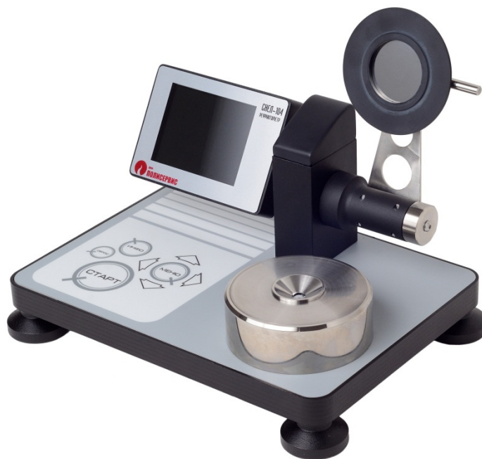
Рисунок 1 – Общий вид рефрактометров

Заводской (серийный) номер наносится печатным способом в виде цифрового обозначения на табличку, расположенную на нижней панели корпуса рефрактометра, общий вид таблички и место нанесения знака утверждения приведены на рисунке 3.