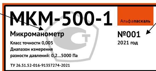
Рисунок 3 – Информационная табличка