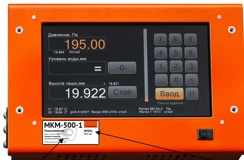
Рисунок 2 – Пульта управления