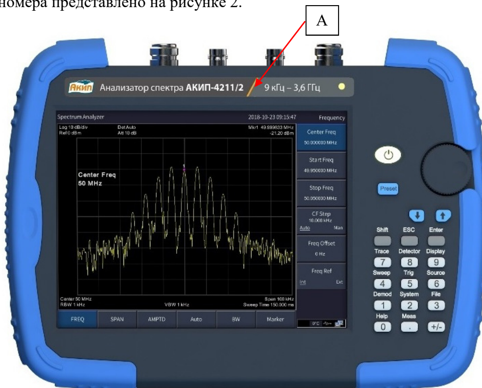
Рисунок 1 – Общий вид анализаторов, место нанесения знака утверждения типа (А)

Заводской (серийный) номер анализаторов состоит из цифрового обозначения и наносится на обратную сторону корпуса при помощи наклейки. Место нанесения заводского (серийного) номера представлено на рисунке 2.