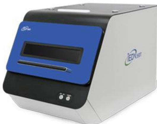
Анализатор iEDX 150T исполнение S, Анализатор iEDX 150T исполнение M