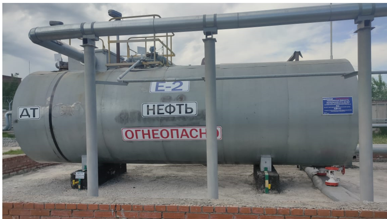
Рисунок 2 – Общий вид резервуара РГС-20 зав.№ 54