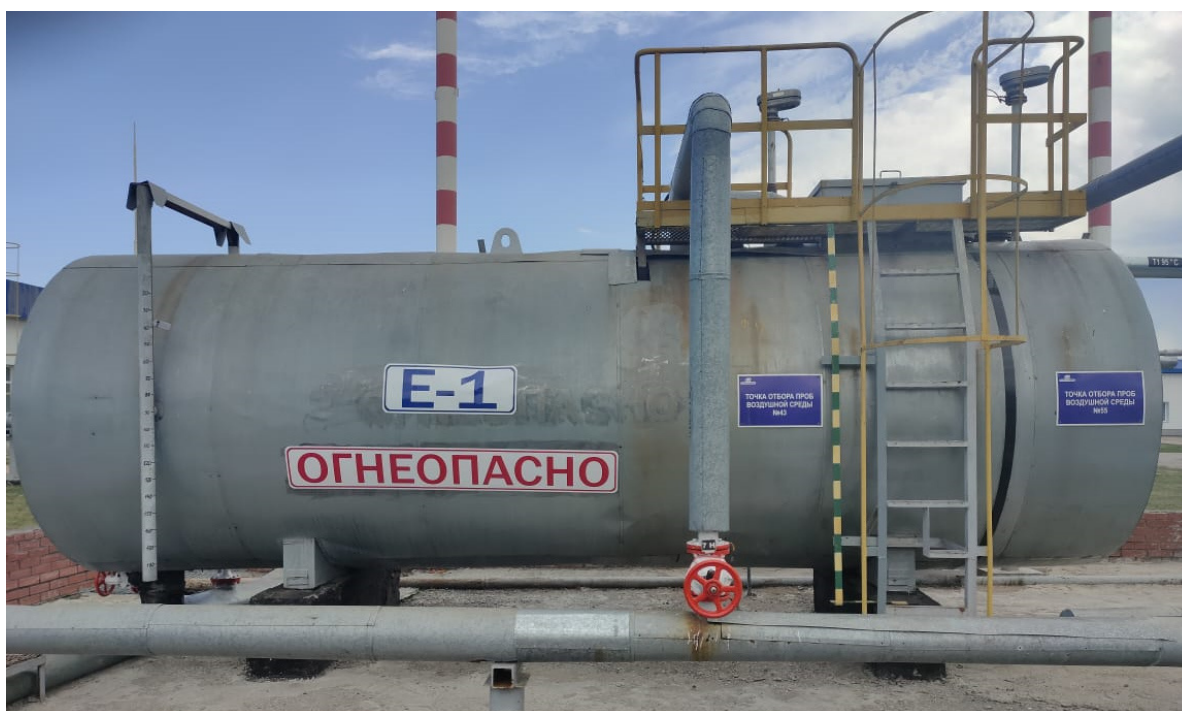
Рисунок 3 – Общий вид резервуара РГС-20 зав.№ 55

Пломбирование резервуаров РГС-20 не предусмотрено.