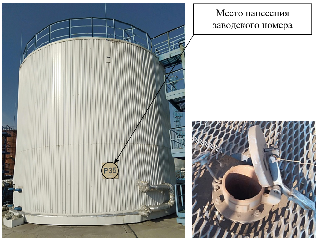
Р и с у н о к 1 – Общий вид резервуара с заводским номером P35 и его замерного люка