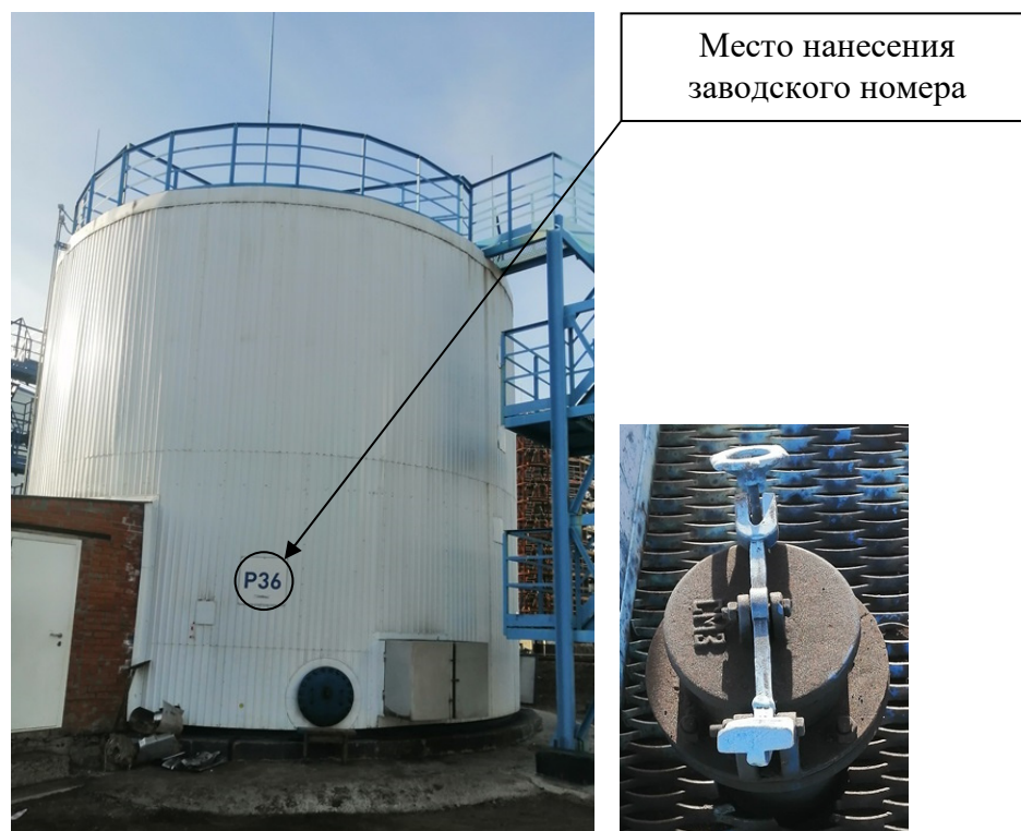
Р и с у н о к 2 – Общий вид резервуара с заводским номером P36 и его замерного люка