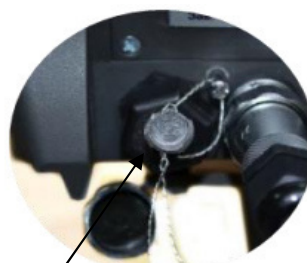
Рисунок 4 – Схема пломбировки и обозначения мест нанесения знака поверки приборов весоизмерительных ТИТАН

Пломба с оттиском с поверительного клейма