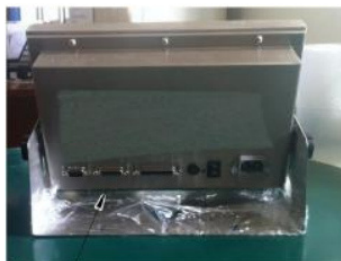
Рисунок 3 – Схема пломбировки и обозначения мест нанесения знака поверки приборов весоизмерительных МИ

Пломба с оттиском с поверительного клейма