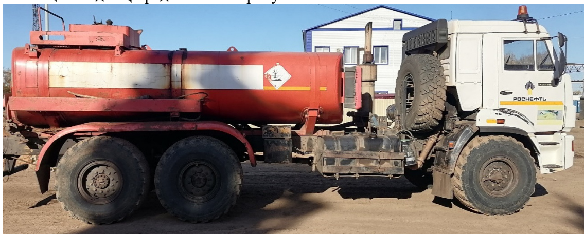
Рисунок 1 – Общий вид АЦ.