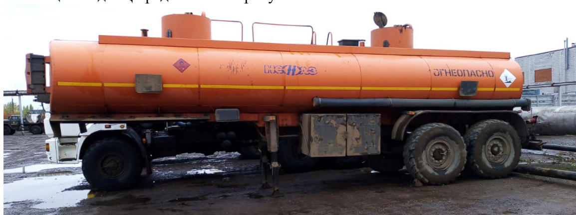
Рисунок 1 – Общий вид ПЦ.