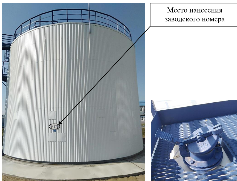
Р и с у н о к 1 – Общий вид резервуара с заводским номером Р-679 и его замерного люка