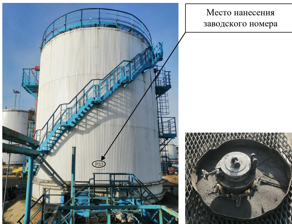
Р и с у н о к 3 – Общий вид резервуара с заводским номером Р33 и его замерного люка