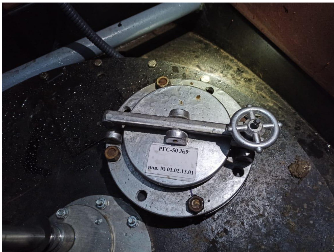
Рисунок 1 – Общий вид резервуара РГС-50 с местом нанесения заводского номера