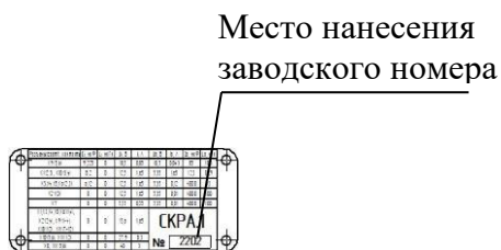
Рисунок 1а - Место нанесения заводского номера СКРА.1

Серийный номер состоит из арабских цифр, нанесенных на маркировочную табличку лазерным способом. Маркировочная табличка находится на корпусе коробки клеммной вводной ККВЗ, входящей в соединительные связующие компоненты, для СКРА.1 и на корпус коробки распределительной КР, входящей в соединительные связующие компоненты, для СКРА.3.