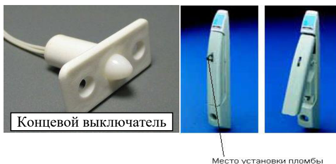
Рисунок 2 – Места установки пломб и нанесения оттисков клейм от несанкционированного доступа на технические средства из состава ПАК ПТК КРУГ-2000

Заводской номер в буквенно-цифровом формате наносится типографским способом на внутреннюю лицевую стенку шкафа в виде наклейки.