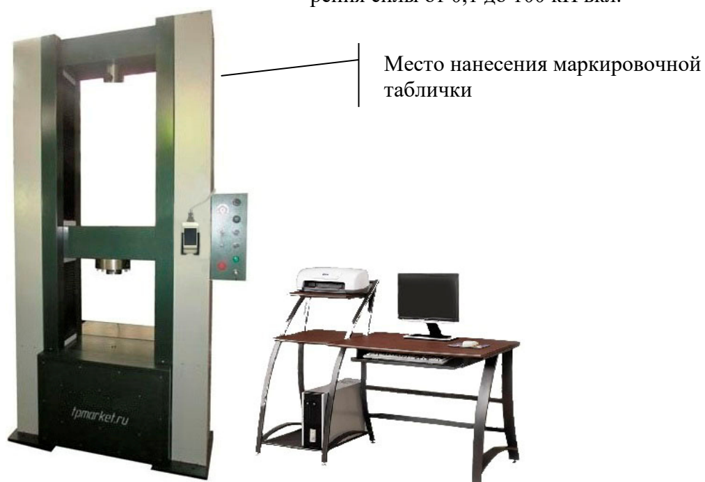
Рисунок 5 - Общий вид машин модификации IP 52Y-PS с верхним пределом диапазона измерения силы от 200 до 600 кН вкл.