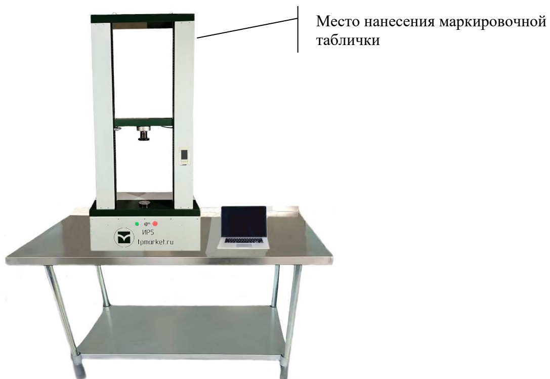
Рисунок 4 - Общий вид машин модификации IP 52YH-PS с верхним пределом диапазона измерения силы от 0,1 до 100 кН вкл.