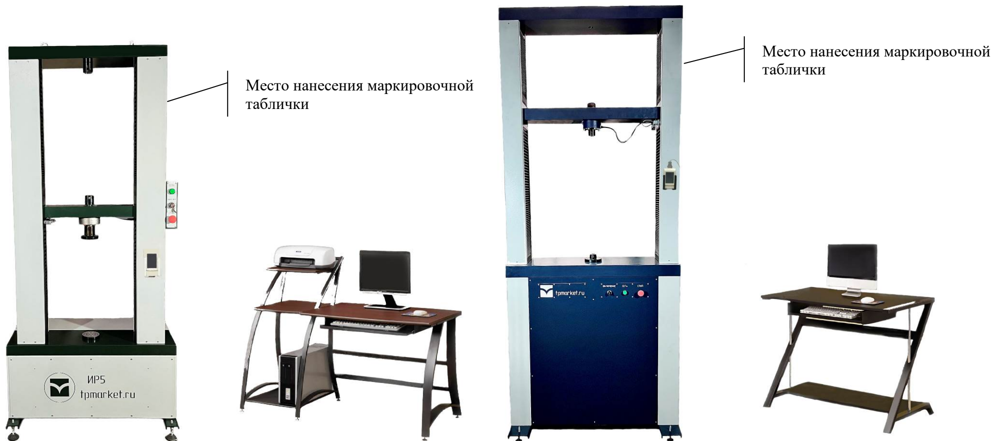
Рисунок 3 - Общий вид машин модификации ИР 52У-PS с верхним пределом диапазона измерения силы от 0,1 до 100 кН вкл.