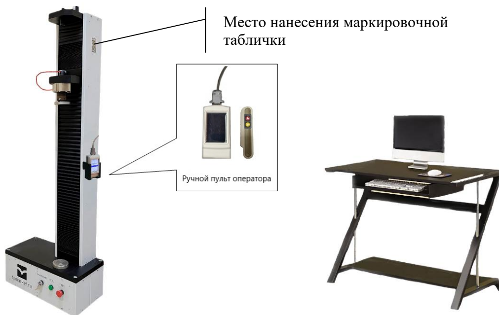
Рисунок 1 – Общий вид машин модификации IP 51Y-PS