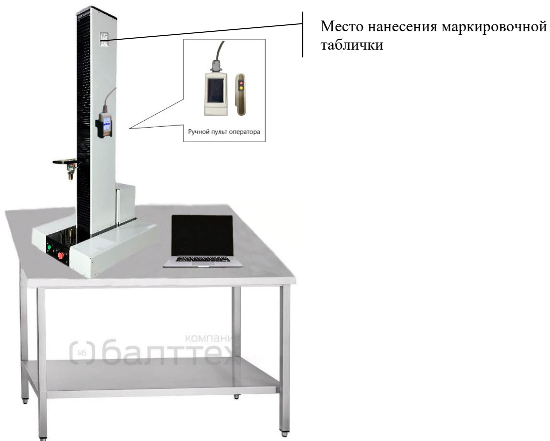
Рисунок 2 – Общий вид машин модификации IP 51YH-PS