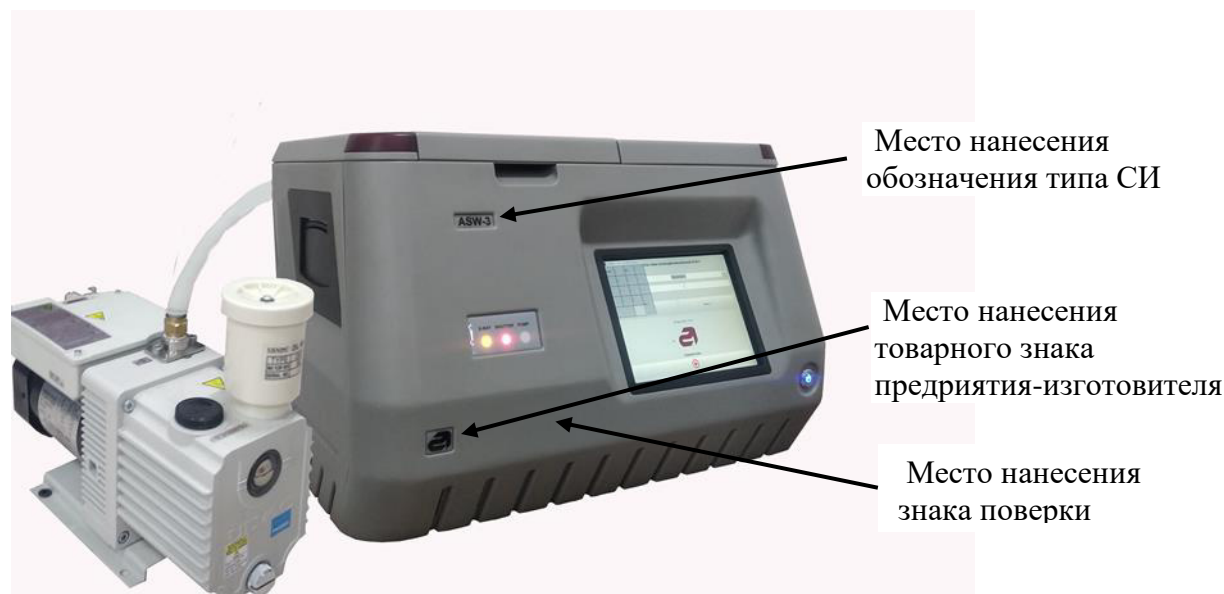
Рисунок 1 – Общий вид анализаторов серы рентгеновских воднодисперсионных АСВ-3

Общий вид анализаторов и место нанесения знака поверки представлен на рисунке 1.