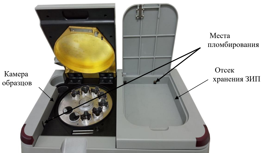
Рисунок 2б – Места установки пломб анализатора на внутренней панели камеры образцов и отсека хранения ЗИП