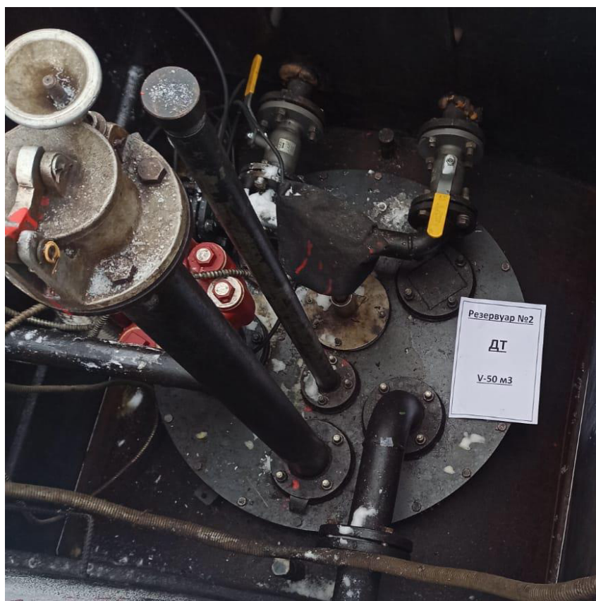
Рисунок 3 – Горловина резервуара РГС-50 зав.№ 2