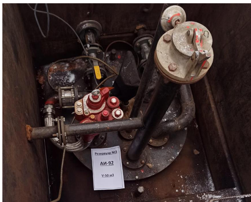
Рисунок 4 – Горловина резервуара РГС-50 зав.№ 3