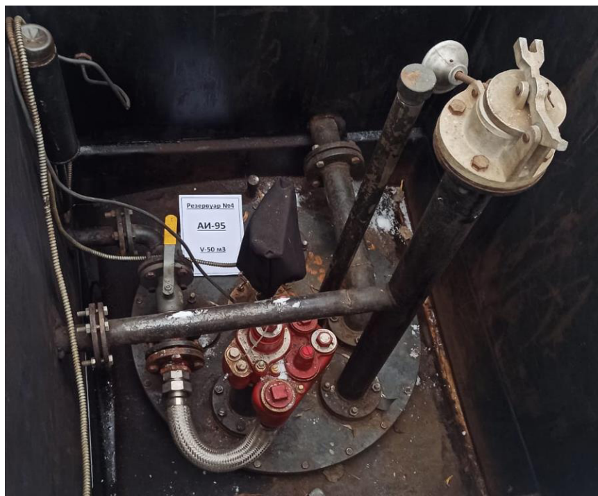
Рисунок 5 – Горловина резервуара РГС-50 зав.№4

Пломбирование резервуаров РГС-50 не предусмотрено.