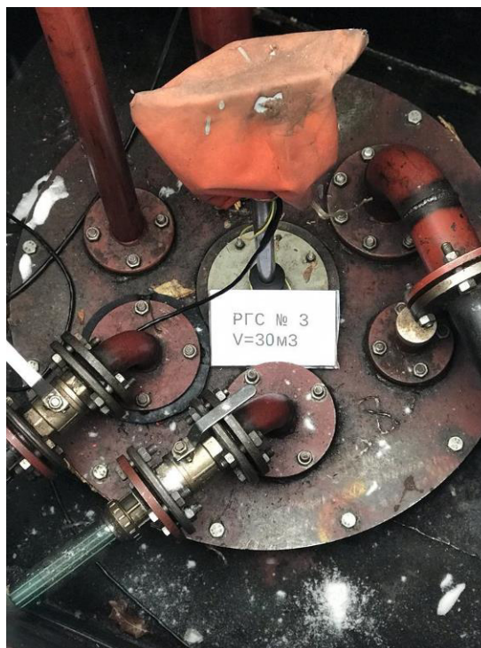
Рисунок 3 – Горловина резервуара РГС-30 зав.№3