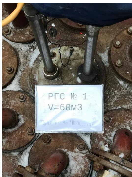
Рисунок 4 – Горловина резервуара РГС-60 зав.№1

Пломбирование резервуаров РГС не предусмотрено.