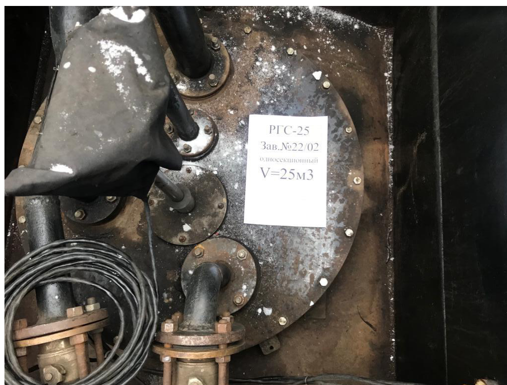
Рисунок 2 – Горловина резервуара РГС-25 зав.№ 22/02