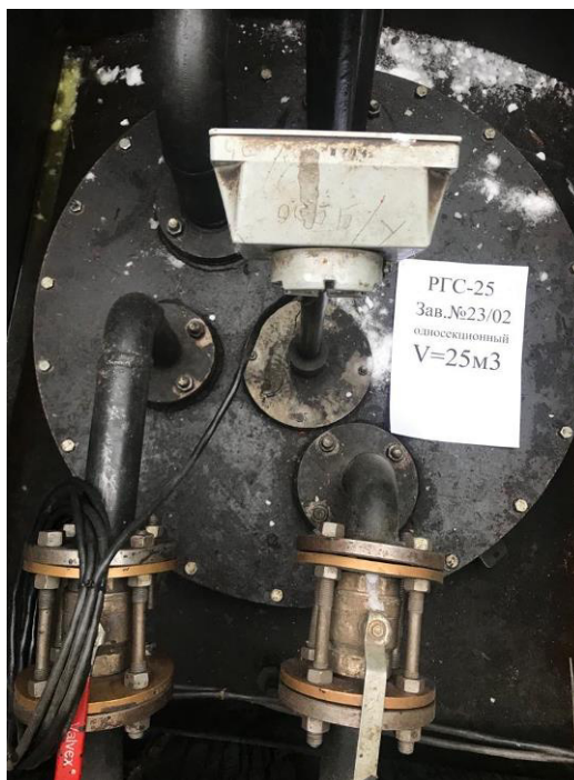
Рисунок 3 – Горловина резервуара РГС-25 зав.№ 23/02

Пломбирование резервуаров РГС-25 не предусмотрено.