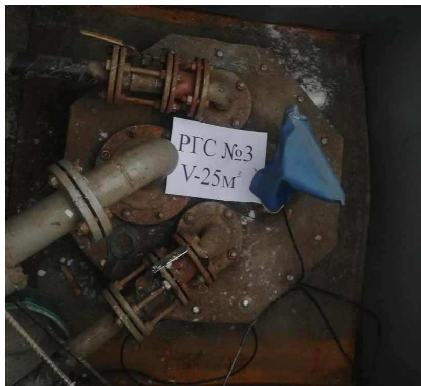
Рисунок 4 – Горловина резервуара РГС-25 зав.№ 3