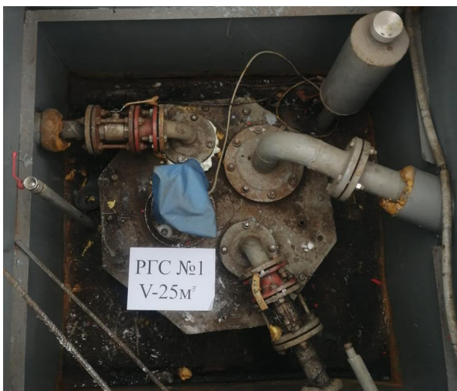
Рисунок 2 – Горловина резервуара РГС-25 зав.№ 1