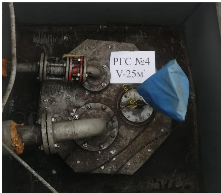
Рисунок 5 – Горловина резервуара РГС-25 зав.№ 4

Пломбирование резервуаров РГС-25 не предусмотрено.