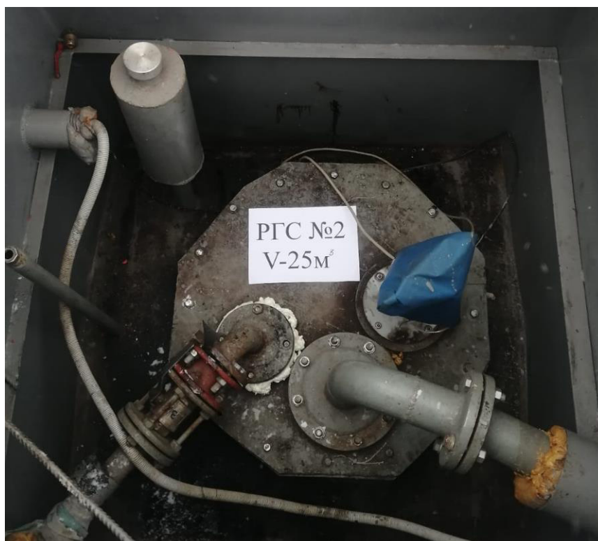
Рисунок 3 – Горловина резервуара РГС-25 зав.№ 2