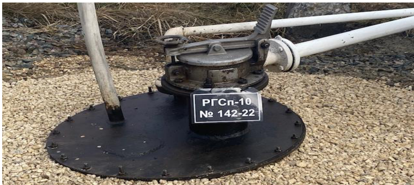
Рисунок 1 - Место нанесения заводского номера резервуара РГСп-10

Пломбирование резервуара не предусмотрено.