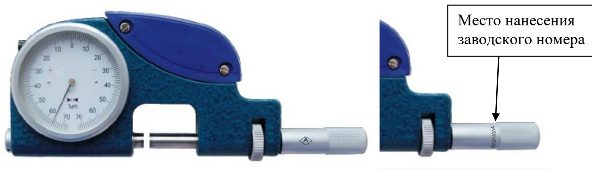
Рисунок 1 – Общий вид скоб с указанием места нанесения заводского номера