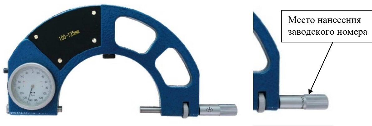
Рисунок 2 – Общий вид скоб с указанием места нанесения заводского номера