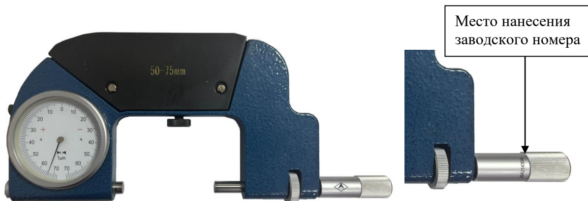
Рисунок 3 – Общий вид скоб с указанием места нанесения заводского номера