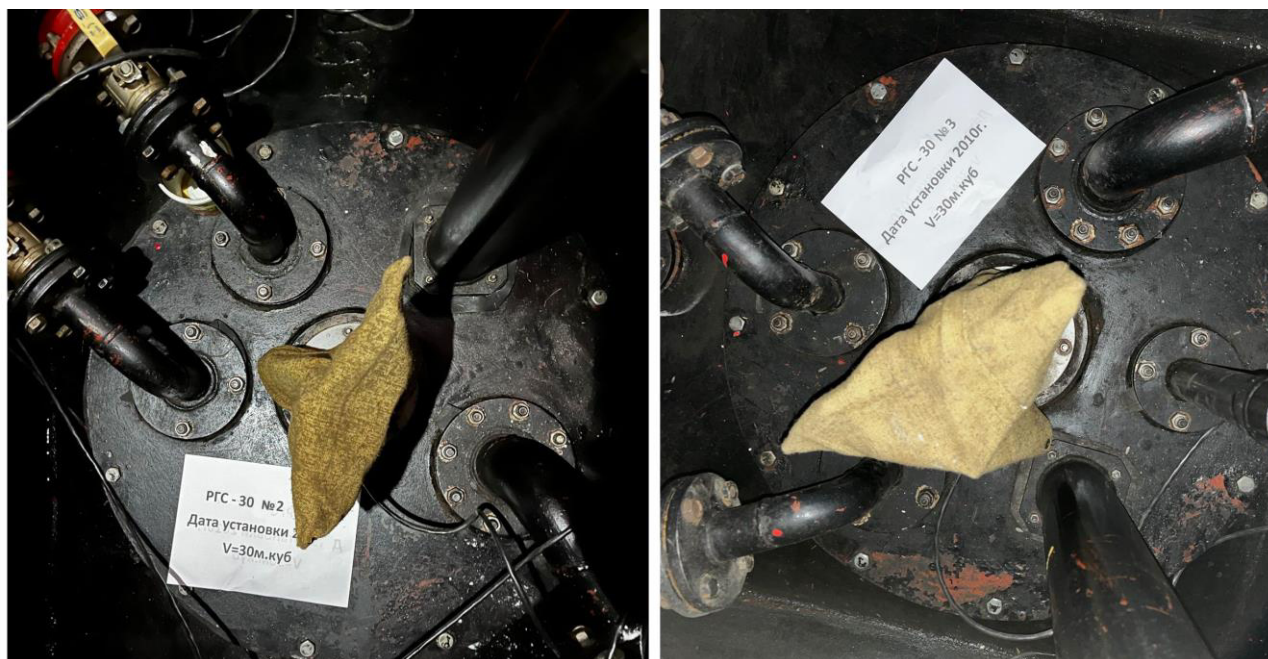
Рисунок 2 – Горловины резервуаров РГС-30 зав.№№2, 3