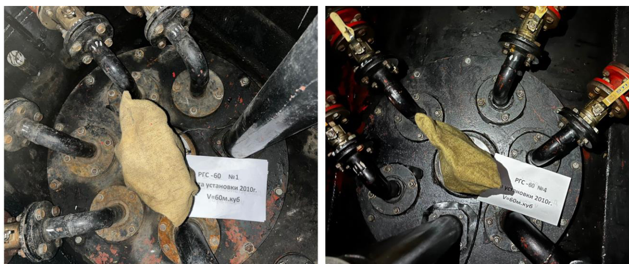
Рисунок 3 – Горловины резервуаров РГС-60 зав.№№1, 4

Пломбирование резервуаров РГС не предусмотрено.