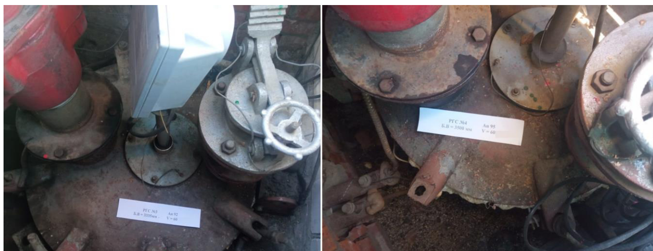
Рисунок 3 – Горловины резервуаров РГС-60 зав.№3, 4

Пломбирование резервуаров РГС-60 не предусмотрено.