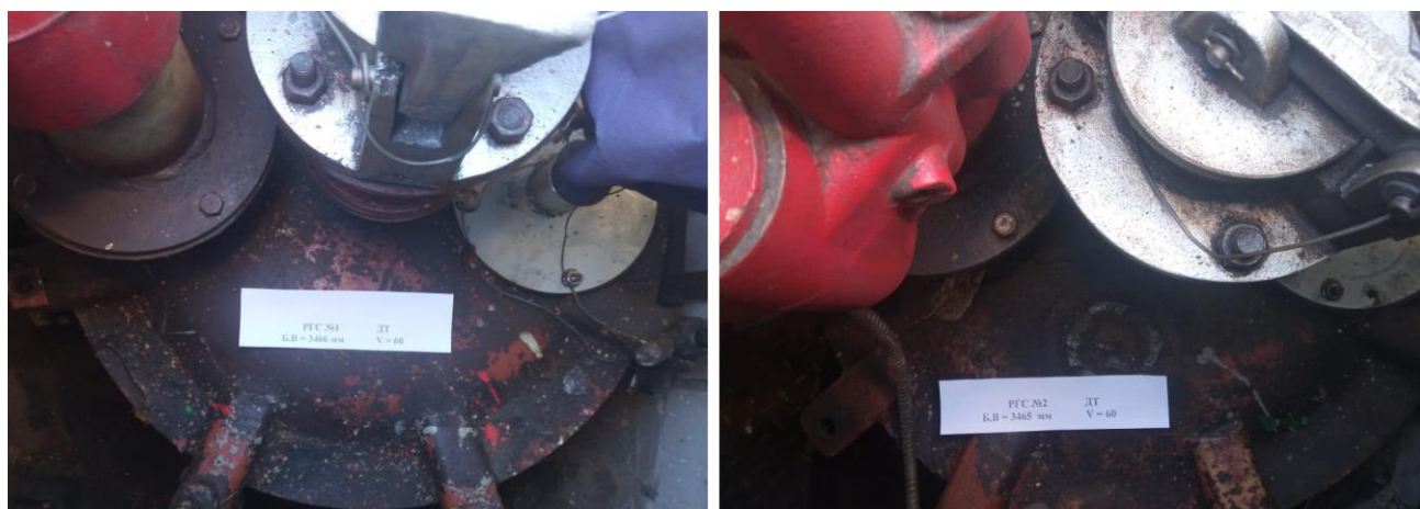
Рисунок 2 – Горловины резервуаров РГС-60 зав.№№1, 2