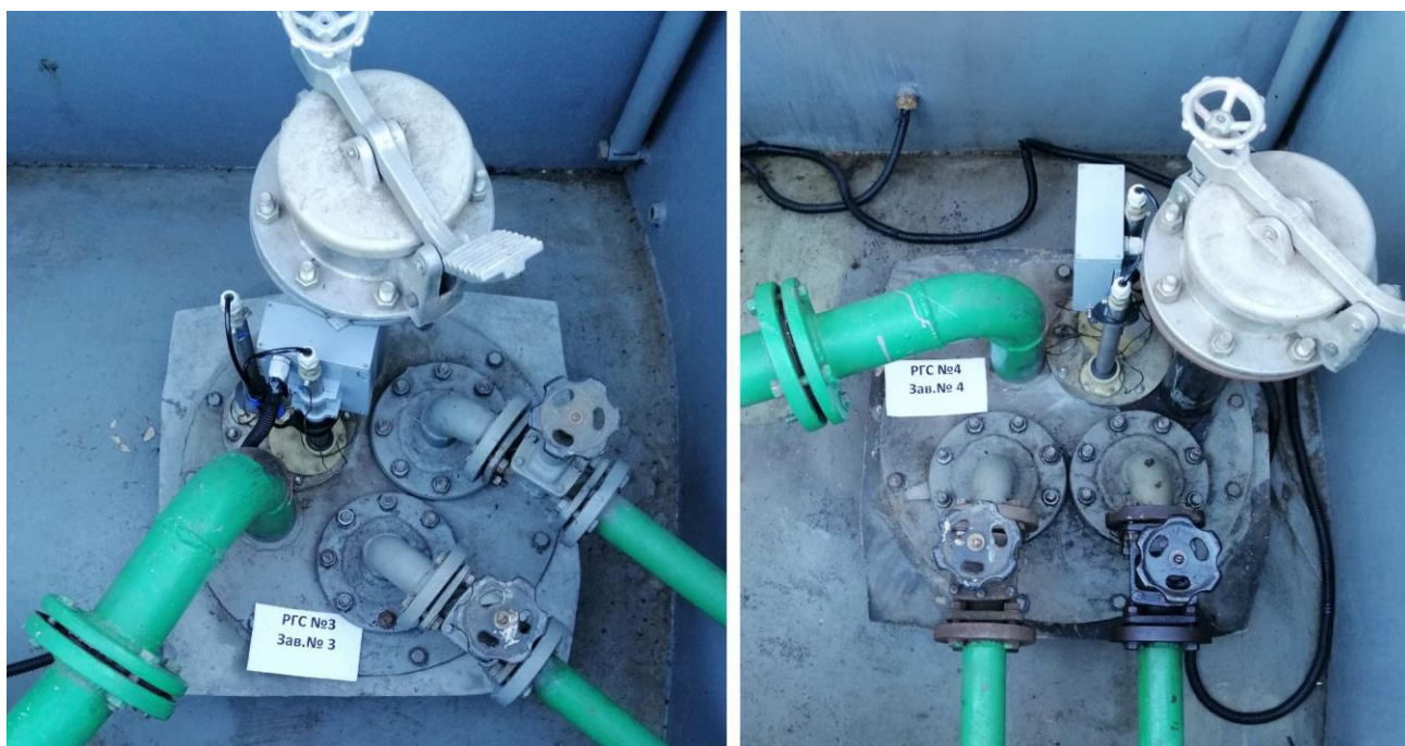
Рисунок 2 – Горловины резервуаров РГС-20 зав.№№ 3, 4