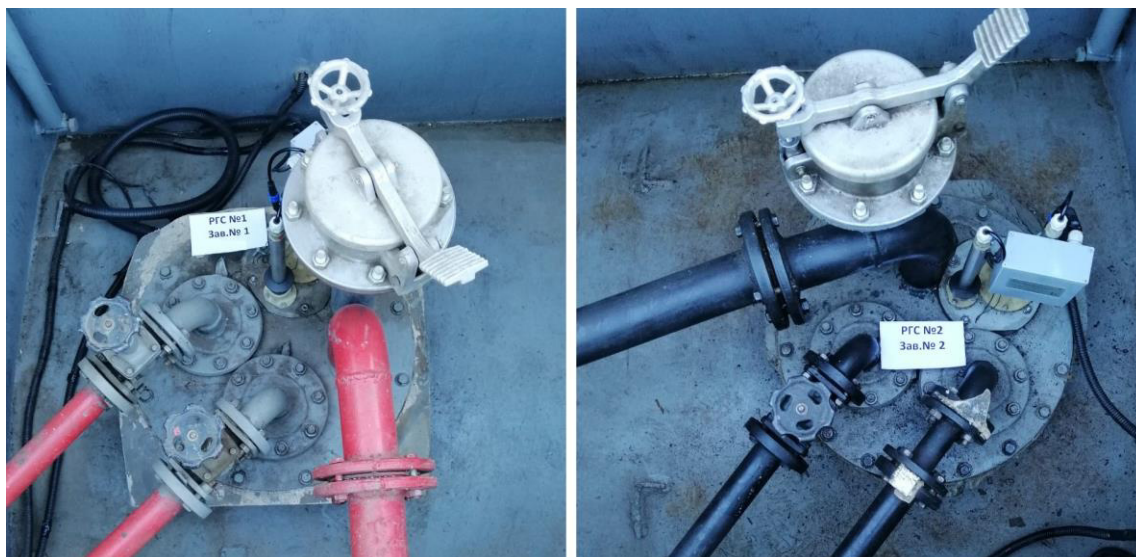
Рисунок 3 – Горловины резервуаров РГС-25 зав.№№ 1, 2

Пломбирование резервуаров РГС не предусмотрено.