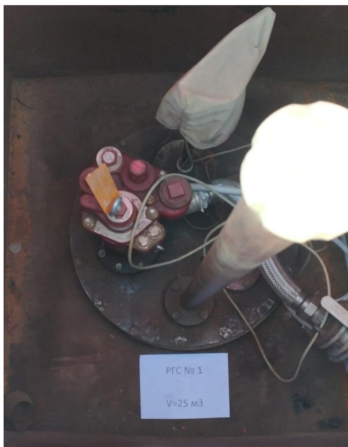
Рисунок 2 – Горловина резервуара РГС-25

Пломбирование резервуара РГС-25 не предусмотрено.