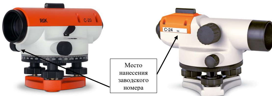
а) - модификация RGK C-20

Общий вид нивелиров оптических RGK представлен на рисунке 1.