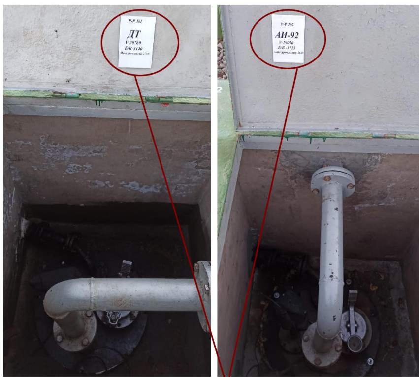
Места нанесения заводских номеров