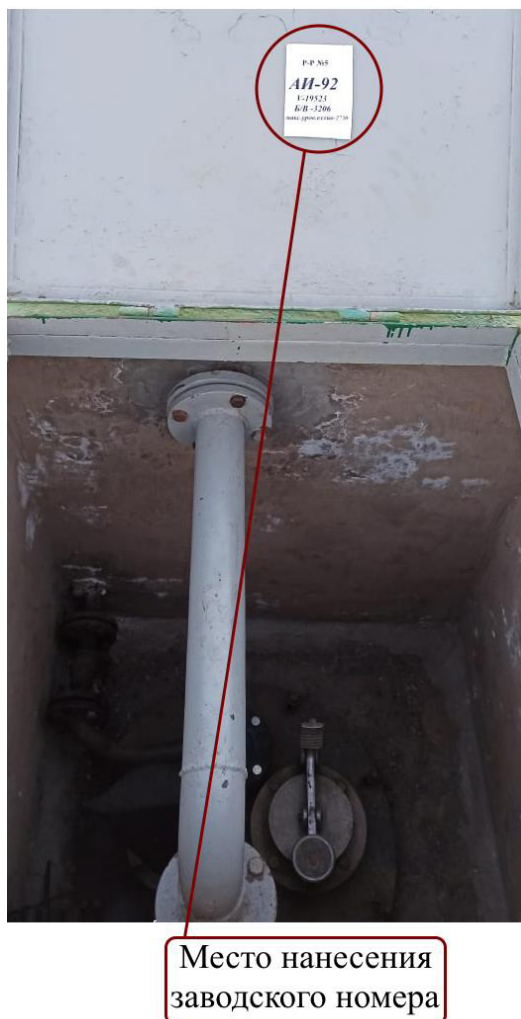
Рисунок 4 – Горловина резервуара РГС-20 зав.№ 5 с указанием места нанесения заводского номера

Пломбирование резервуаров РГС-20 не предусмотрено.