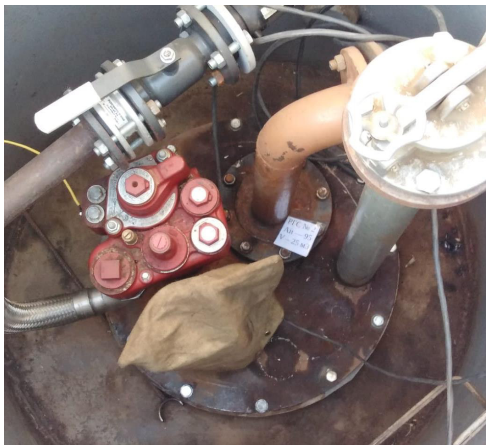
Рисунок 2 – Горловина резервуара РГС-25 зав.№ 2