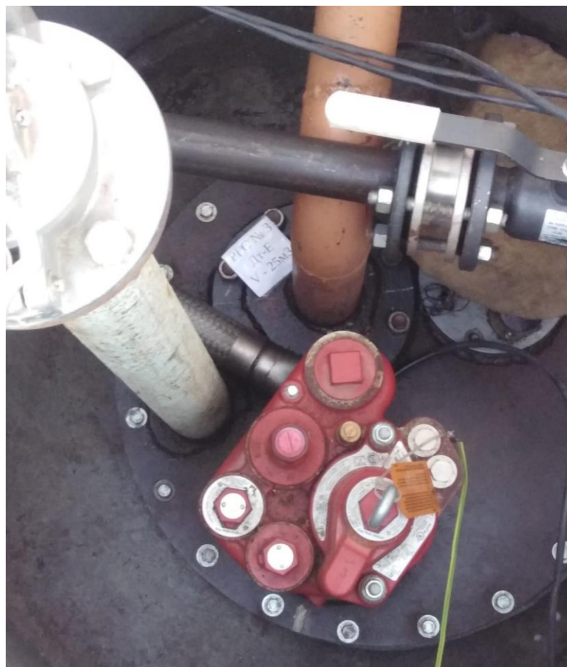
Рисунок 3 – Горловина резервуара РГС-25 зав.№ 3

Пломбирование резервуаров РГС-25 не предусмотрено.