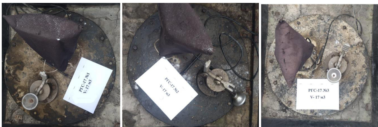
Рисунок 2 – Горловины резервуаров РГС-17 зав.№№ 1, 2, 3