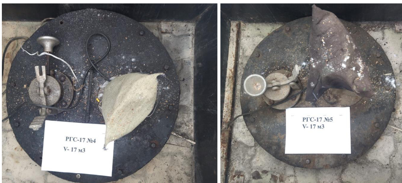
Рисунок 3 – Горловины резервуаров РГС-17 зав.№№ 4, 5