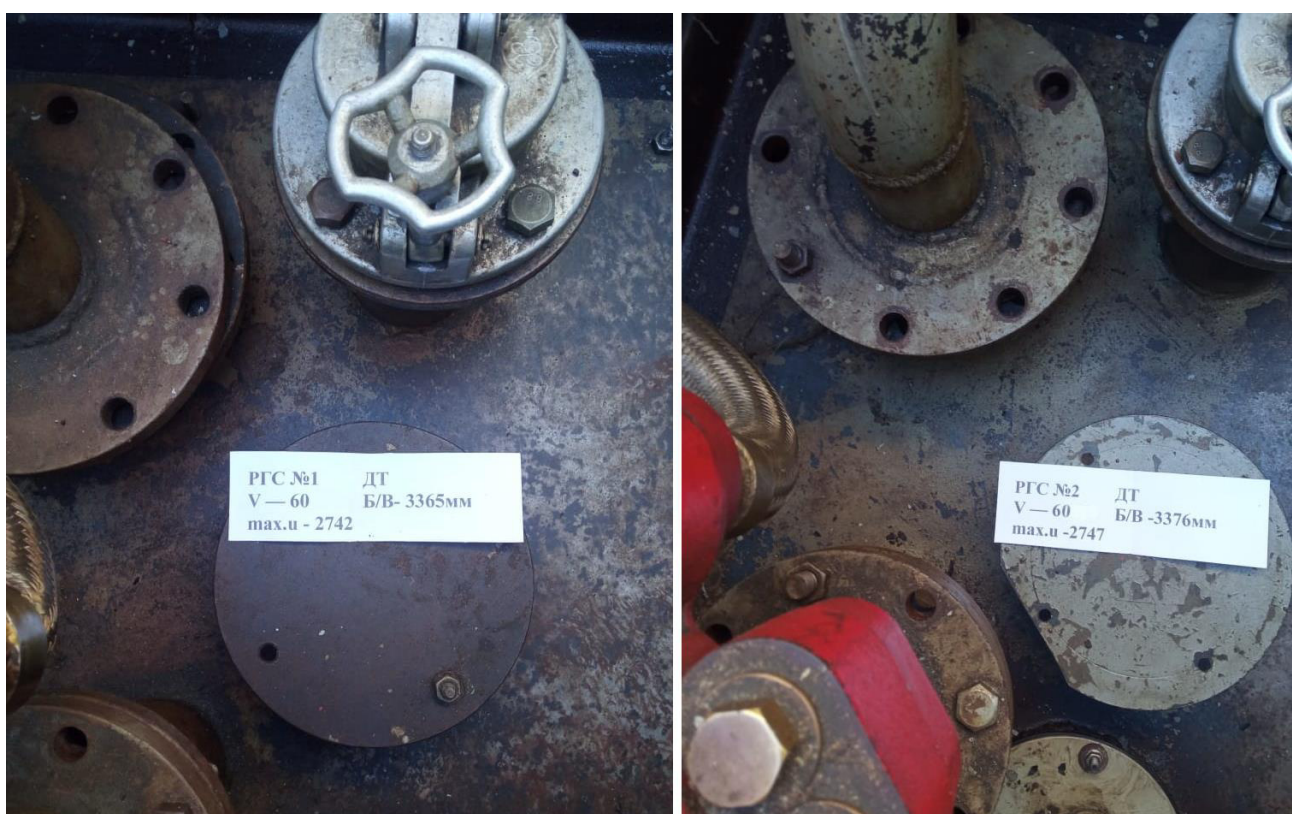
Рисунок 2 – Горловины резервуаров РГС-60 зав.№№1, 2