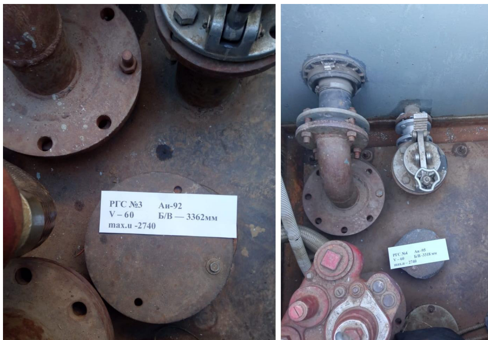
Рисунок 3 – Горловины резервуаров РГС-60 зав.№3, 4

Пломбирование резервуаров РГС-60 не предусмотрено.