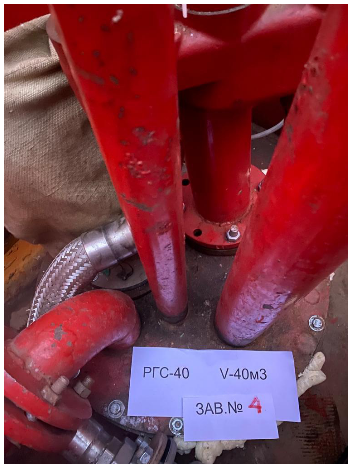
Рисунок 2 – Горловина резервуара РГС-40 зав.№ 4