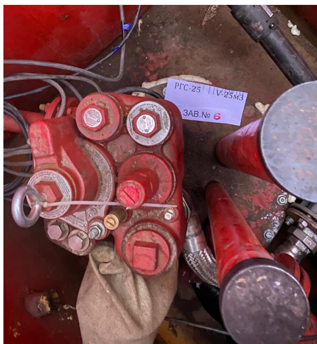
Рисунок 3 – Горловина резервуара РГС-25 зав.№ 6

Пломбирование резервуаров РГС-25 не предусмотрено.