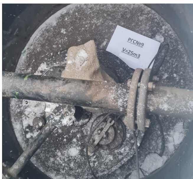
Рисунок 4 – Горловина резервуара РГС-25 зав.№9

Пломбирование резервуаров РГС не предусмотрено.