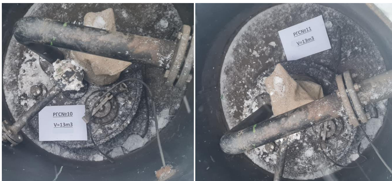
Рисунок 2 – Горловины резервуаров РГС-13 зав.№№10, 11