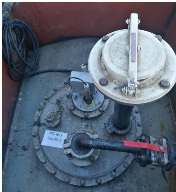
Рисунок 2 – Горловина резервуара PГC-20

Пломбирование резервуара PГC-20 не предусмотрено.